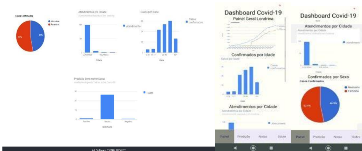
Figura 5 – Dashboard da aplicação web (à esquerda) e mobile (à direita).