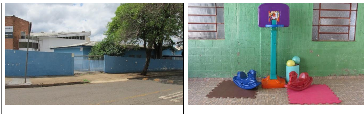
Quadro 3 – Registros fotográficos – C.E.I. Estrelinha

No dia 26/10/2021 foram realizados a doação de duas gangorras cavalinhos, um liquidificador industrial, 70 livros infantis e 96 brinquedos provenientes da Campanha de Arrecadação de Brinquedos, Livros Infantis e Gibis da Faculdade da Indústria Senai Londrina. No dia 05/11/2021 foi realizada a doação de uma tabela de basquete. Os registros fotográficos da ação estão listados no Quadro 3.